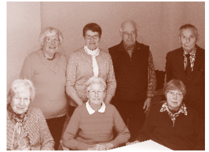
(Teil des Biblischen Gesprächskreises)

donnerstags im Dienst und an diesen Tagen auch zu erreichen. Ansonsten hinterlassen Sie mir doch gerne auf dem Anrufbeantworter eine Nachricht.