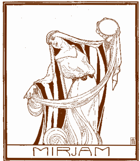
„Mirjam“ von E.M. Lilien

„Singt dem HERRN, denn hoch hat er sich erhoben...“ - dieser Vers aus dem 2. Buch Mose wird von Mirjam gesungen. Ich kann sie vor meinem inneren Auge sehen, wie sie mit der Trommel in der Hand und das Tanzbein schwingend ihrem Gott ein Loblied singt. Gott hatte